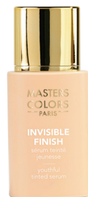
Ref: 315042 Invisible Finish 40 30 ml