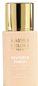
Ref: 315032 Invisible Finish 30 30 ml