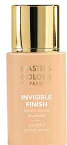
Ref: 315062 Invisible Finish 60 30 ml

Vydává EST-OUEST CONSEILS Praha s.r.o., výhradní distributor značky Masters Colors pro ČR, Biskupská 6, 110 00 Praha 1, Tel.: +420 211 221 726, e-mail: info@eoc.cz, www.eoc.cz