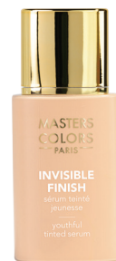
Ref: 315052 Invisible Finish 50 30 ml